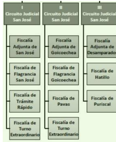
Diagrama 1 Organización de las Fiscalías del Grupo 5