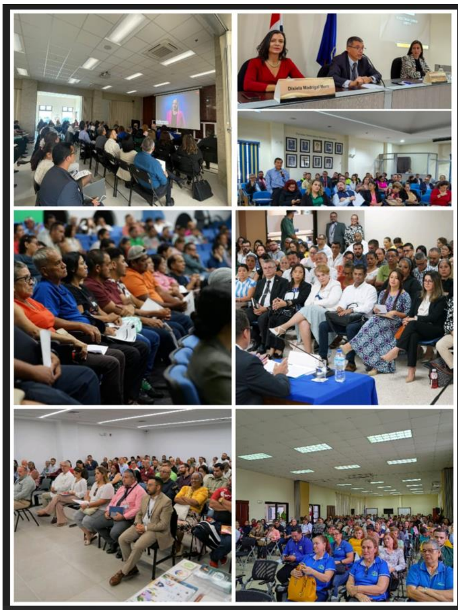
Fotografías tomadas durante las mesas de diálogo, 2023.

En el periodo se realizaron ocho actividades de rendición de cuentas, efectuadas por las fiscalías territoriales, la Columna de Fiscalías para la Atención de Poblaciones Vulnerables, Oficina de Atención y Protección a la Víctima y la Oficina de Defensa Civil de la Víctima.