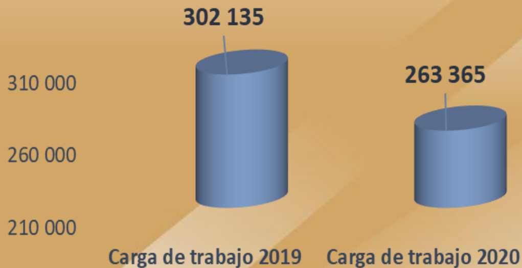
Gráfico 2. Comparación carga de trabajo años 2019 y 2020