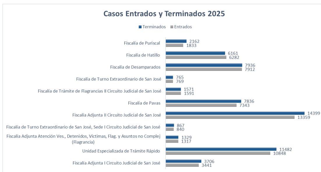
Tabla 1 Ministerio Público- Fiscalías Territoriales Casos entrados y terminados por fiscalías