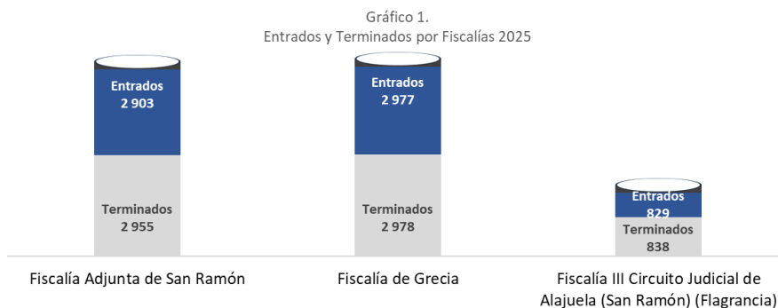
Gráfico 1 Ministerio Público- Fiscalías Territoriales Fiscalía Adjunta de San Ramón Casos entrados y terminados Periodo 2025